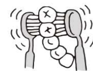
奥歯の外側・内側