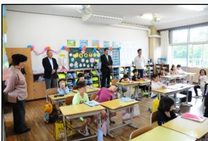
学校運営協議会委員の方々による授業参観

古河市教育委員会生涯学習課2名の方にもご来校頂き、コミュニティスクールや地域学校協働活動についてご説明頂きました。