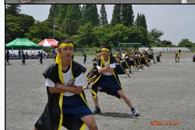
体育発表会予行での児童の様子

ゴールデンウィーク明けから、体育発表会のための練習を行ってきました。この5月は雨が多く、思うように練習が進みませんでした。しかし、何とか5月21日(火)に予行を行うことができました。本年度も、ブロックごとの種目進行で、全校児童での開催となり、新演技もあります。お子様の活躍をご覧ください。