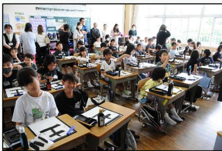
授業参観の一場面

4月26日(金)、授業参観を実施しました。国語・書写など様々な授業が行われ、多くの方々に参観して頂きました。児童たちも、はりきって学習を行うことができました。昨年度より多くの方に参観して頂くことができました。