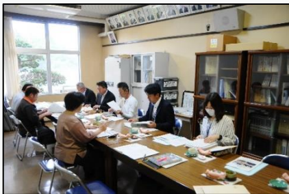
教育委員会の方々を交えての学校運営協議会委員会の様子